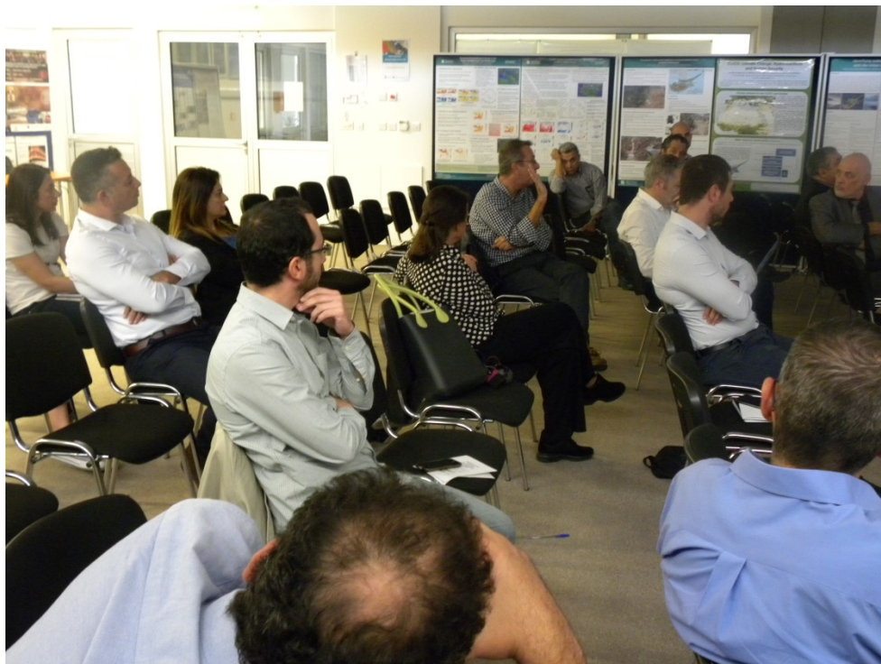
Στιγμιότυπο από την εκδήλωση